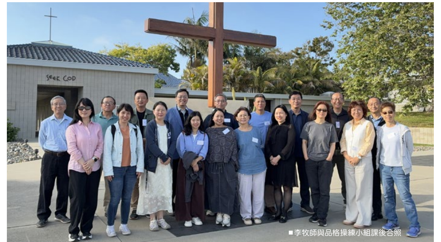
■ 李牧師與品格操練小組課後合照

靈命塑造不是少數人的需要，而是對所有基督徒的呼召。在忙碌與分心的時代，神呼召我們回到與祂同行的生命。SCFC 邀請牧者與教會一同踏上這條轉化之路，透過諮詢、退修、課程與操練小組，建立與神同行的生命節奏，使信徒不僅認識神，更被祂更新。願神帶領我們，從活動走向轉化，從知識進入生命，在聖靈能力中活出基督。✠