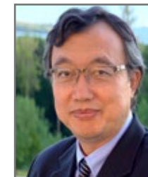
金剛牧師 卡城華人基督教會

我 們教會參加了北美華神第一屆CEP蓬勃教會事工。回顧2022-2023兩年的CEP實體學習和實踐操練，以及對教會持續的影響，我們看見神如何藉CEP在祂所愛的教會中成就了祂奇妙的作為。願榮耀、頌讚和感謝都歸給愛我們的神和主耶穌基督！